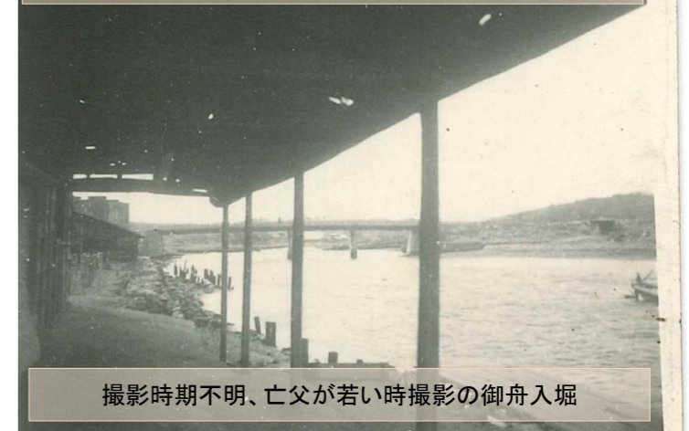
撮影時期不明、亡父が若い時撮影の御舟入堀

S35チリ津波までは、醤油工場の堀へ突き出した屋根の下で、雨の日でも釣りをしていた記憶がある